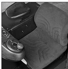
Täysin säädettävä istuin

Jatkuva kehitystyömme voi aiheuttaa muutoksia näihin teknisiin tietoihin.